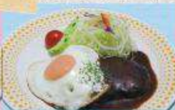
ハンバーグ定食 ¥800 (単品) ¥560