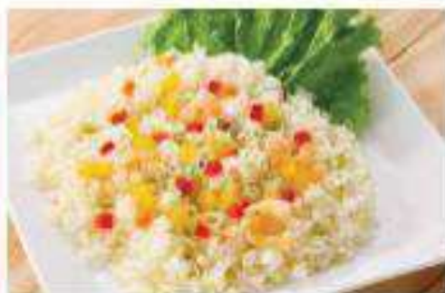
エビピラフ Shrimp Rice ¥650 (税込¥702)