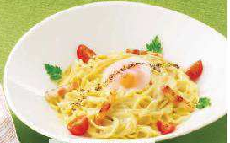
とろーり温泉カルボナーラ Carbonara with runny-boiled egg ¥690 (税込¥745)