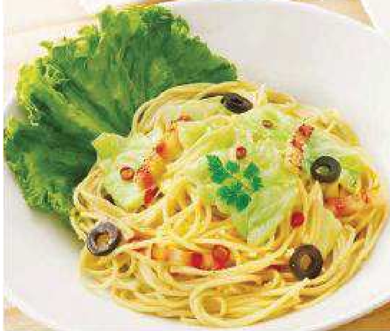
ベーコンとキャベツのペペロンチーノ Spaghetti with Bacon and Cabbage ¥650 (税込¥702)