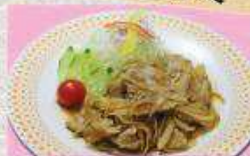
生姜焼き定食 ¥800 (単品) ¥560