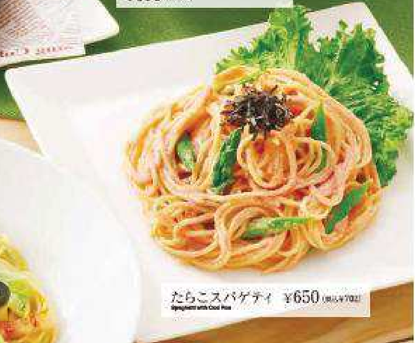
たらこスパゲティ ¥650 (税込¥702) Spaghetti with Cod Roe