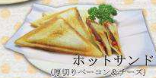
ホットサンド (厚切りベーコン&チーズ) ¥490