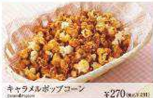
キャラメルポップコーン Caramel Popcorn ¥270 (税込 ¥295)