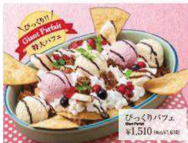
びっくりパフェ Giant Parfait ¥1,510 (税込 ¥1,630)

濃厚ガトーショコラで、ココのあるクリームをサンドした しっとり食感のスイーツです。