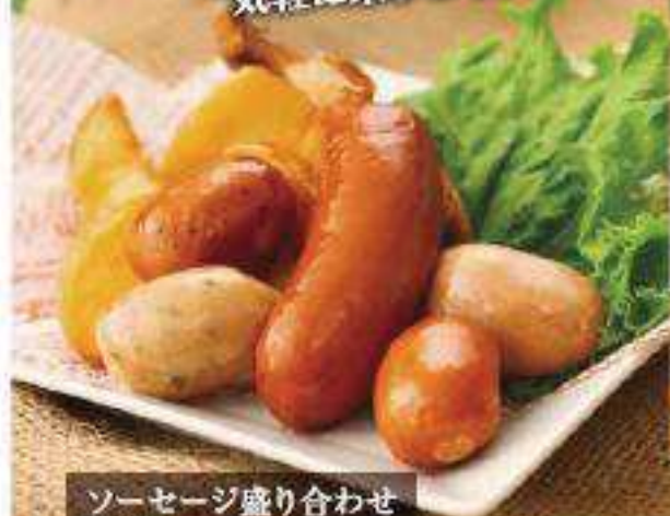
ソーセージ盛り合わせ Sausage Platter ¥660 (税込 ¥712)