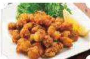
軟骨揚げ しそ風味 Bacon Leaf / Bacon Chicken Fried Chicken Carriage ¥400 (税込¥432)