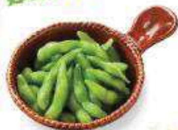
枝豆 ¥340 (税込 ¥367) Edamame Beans