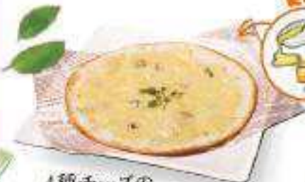
4種チーズの トルティーヤピザ Four Cheese Tortilla Pizza ¥430 (税込 ¥464)