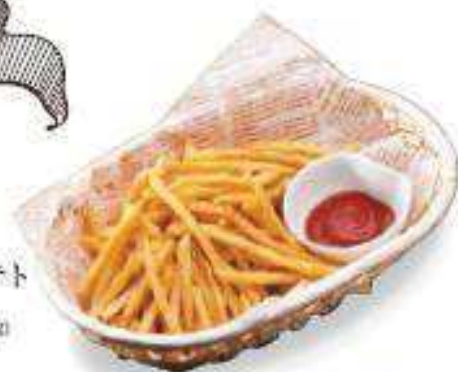
クラランチポテト Crispy Fries ¥400 (税込¥432)