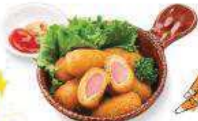
ミニアメリカンドッグ Mini Corn Dogs ¥450 (税込 ¥486)