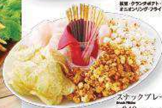
スナックプレート Snack Platter ¥940 (税込 ¥1,015)

ポップコーン・キャラメルポップコーン・ ポテトチップスのりしお・えびせん・ポッキー