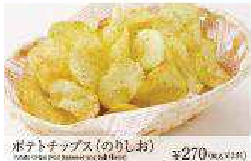
ポテトチップス(のりしお) Potato Chips (Nori Seasoned Salt) ¥270 (税込 ¥295)