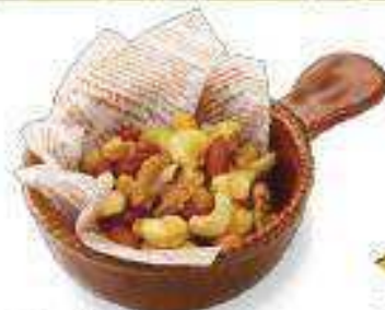
ミックスナッツ Nuts ¥370 (税込¥399)