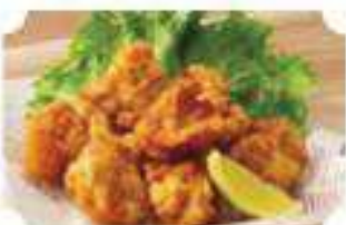
鶏の唐揚げ Fried Chicken ¥580 (税込¥628)