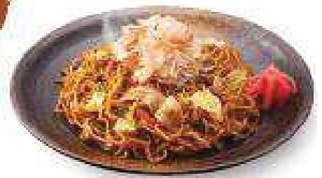
ソース焼きそば Soy Sauce Soba ¥460 (税込¥492)