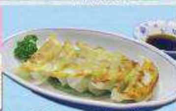
ギョーザ定食 ¥800 (単品) ¥460