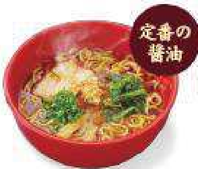
醤油ラーメン Shoyu Ramen ¥580 (税込¥628)