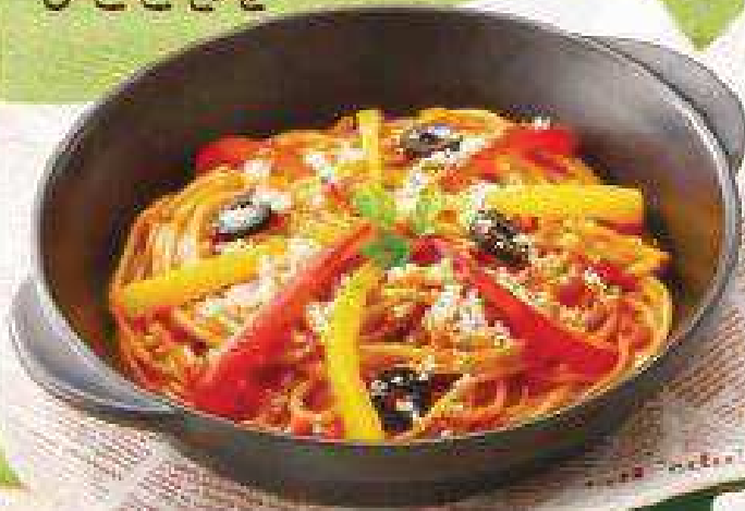
昔懐かしナポリタン ¥690 (税込¥745) Traditional Neapolitan Spaghetti