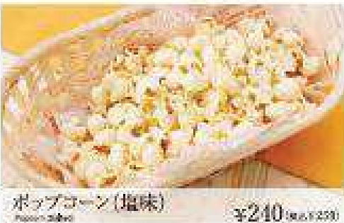
ポップコーン(塩味) Popcorn (Salted) ¥240 (税込 ¥255)

※盛り合わせ、盛り次第と異なる場合がございます。また、季節により所仕合せが異なる場合がございます。ご了承ください。 ※ポッキーによりお全量減額いたします。価格が異なります。ご了承ください。 ※お歳暮等の贈り物は販売していません。ご利用は、お断りさせていただきます。