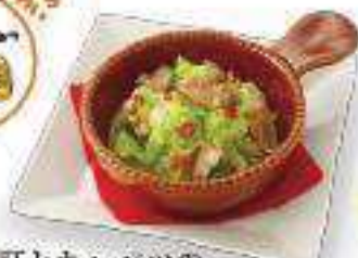
砂肝とキャベツの ベベロンチーノ Sausage and Cabbage with Peppercorn Sauce ¥400 (税込 ¥432)