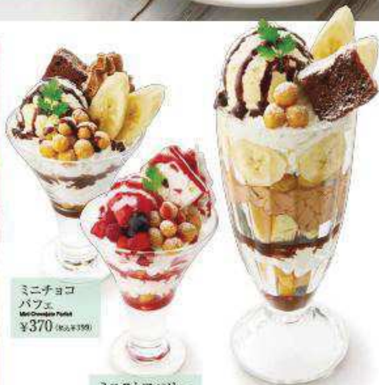
ミニチョコ パフェ Mini Chocolate Parfait ¥370 (税込 ¥399)