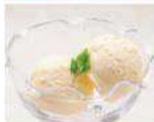
バニラアイス Vanilla Ice ¥270 (税込 ¥291)