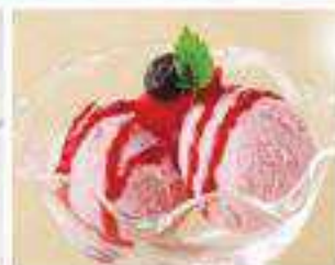
ベリーベリー ストロベリーアイス Berry-Berry Strawberry Ice ¥290 (税込 ¥313)