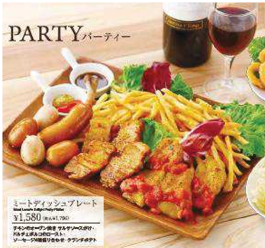
ミートディッシュプレート Meat Dish Party Platter ¥1,580 (税込 ¥1,790)

アインのオープン焼き サルゲースがけ・ カステルポネのロースト・ ソーセージ4種盛り合わせ・クラッシュポテト