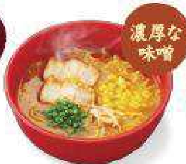
味噌ラーメン Miso Ramen ¥580 (税込¥628)