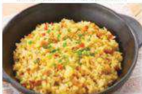
五目炊飯 Mixed Fried Rice ¥650 (税込¥702)