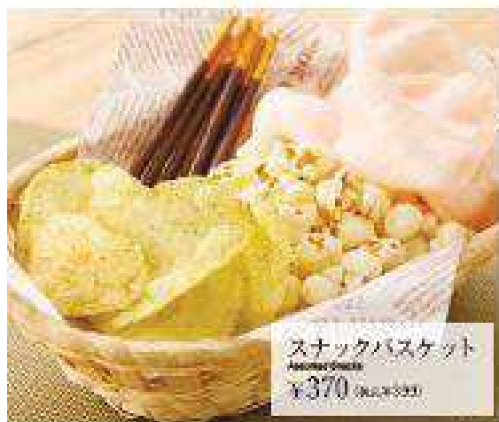
スナックバスケット Snack Basket ¥370 (税込 ¥395)