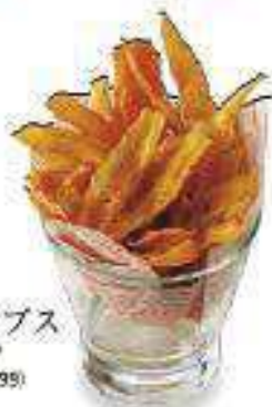
ごほうチップス Fried Seafood Fried Chips ¥370 (税込¥399)