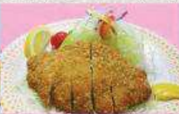
トンカツ定食 ¥800 (単品) ¥560