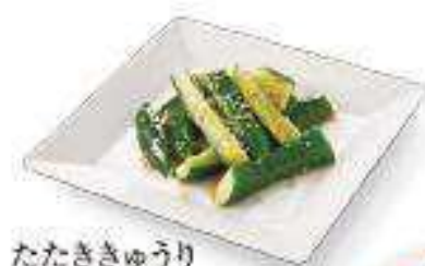
たたききゅうり Marinated Cucumber ¥370 (税込¥399)