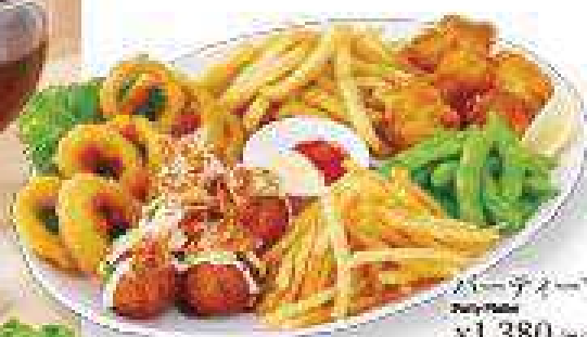
パーティープレート Party Platter ¥1,380 (税込 ¥1,495)

アインのオープン焼き サルゲースがけ・ カステルポネのロースト・ ソーセージ4種盛り合わせ・クラッシュポテト