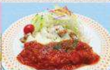
チキンのチーズ焼き定食 ¥800 (単品) ¥560