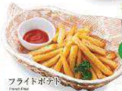
フライドポテト French Fries ¥400 (税込¥432)