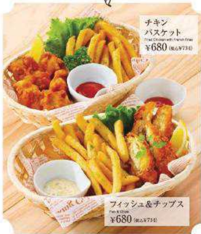
チキン バスケット Fried Chicken with French Fries ¥680 (税込¥734)