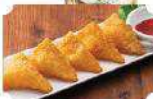
もちもちチーズ揚げ Softy Fried Cheese ¥410 (税込¥442)