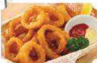
オニオンリング Onion Rings ¥530 (税込¥572)