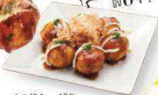
たこ焼き ¥400 (税込 ¥432) Tako-yaki