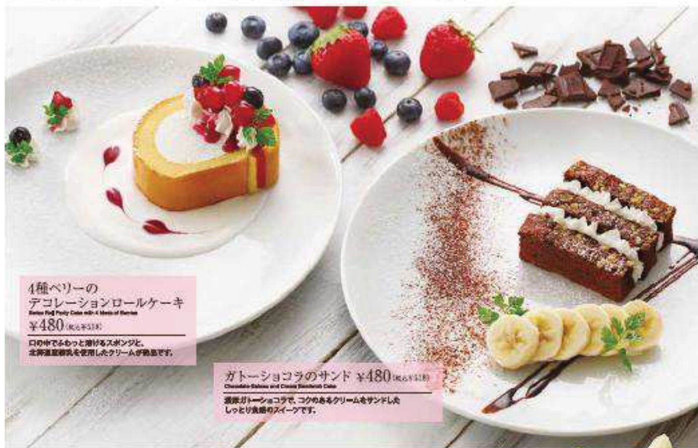
4種ベリーの デコレーションロールケーキ Baked Pink Party Cake with 4 kinds of Berries