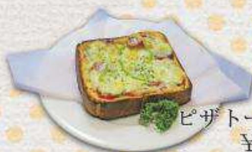
ピザトースト ¥490 トースト ¥290