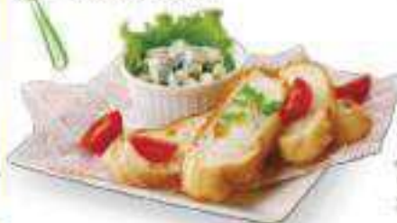
ゴルゴンゾーラの バゲット添え Gorgonzola Cheese with Baguette ¥560 (税込 ¥604)