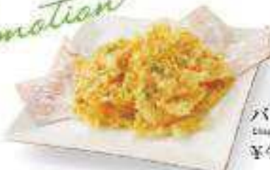
バリバリチーズ Crispy Cheese ¥400 (税込 ¥432)