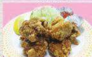
鶏の唐揚げ定食 ¥800 (単品) ¥626