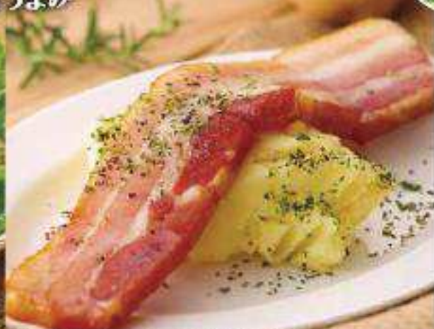
厚切りベーコンのポテトサラダ Potato Salad Topped with Thick Cream Sauce ¥560 (税込 ¥604)