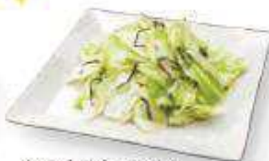
おつまみキャベツ Gummy Pickle ¥320 (税込 ¥345)