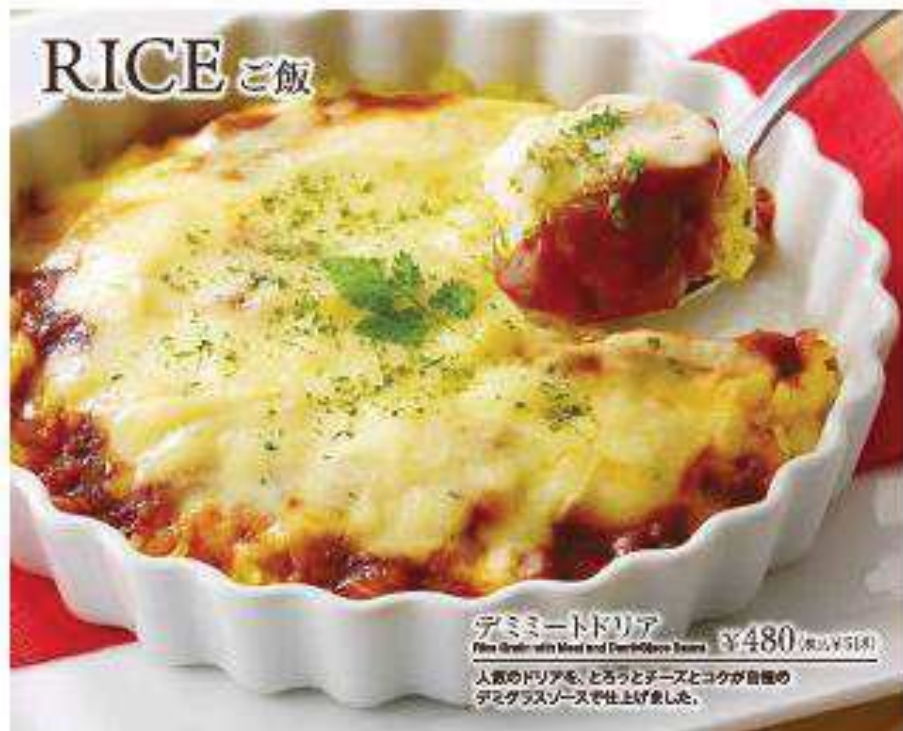
デミミートドリア Fine Grain with Meat and Dutch-Style Sauce ¥480 (税込¥518)